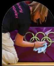
OLYMPIQUE, CNO ET CNP