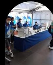
SERVICES AUX MÉDIAS