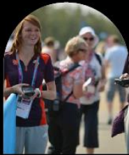
SERVICE AUX SPECTATEURS